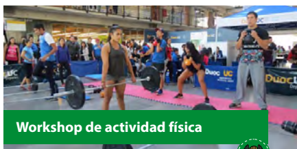
Workshop de actividad física