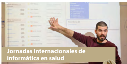
Jornadas internacionales de informática en salud