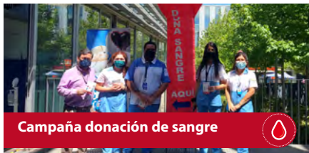
Campaña donación de sangre

La escuela de salud adhiere a la definición de VCM de la institución y concreta vínculos con distintos sectores productivos a través de actividades Hito en las que como estudiante podrás participar activamente :