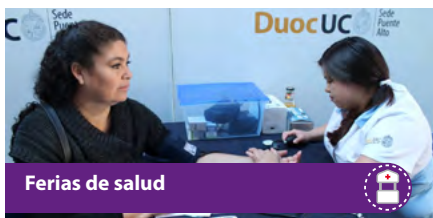
Ferias de salud