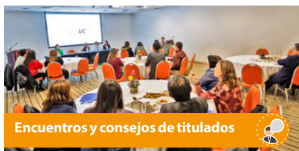
Encuentros y consejos de titulados