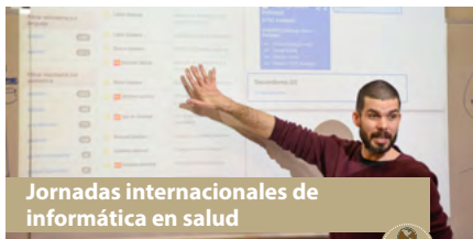
Jornadas internacionales de informática en salud