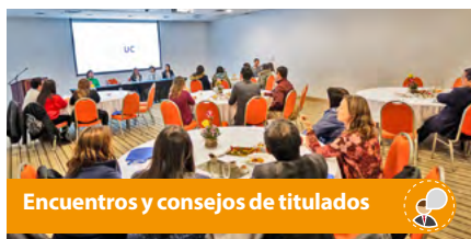
Encuentros y consejos de titulados