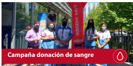
Campaña donación de sangre

La escuela de salud adhiere a la definición de VCM de la institución y concreta vínculos con distintos sectores productivos a través de actividades Hito en las que como estudiante podrás participar activamente :