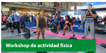
Workshop de actividad física